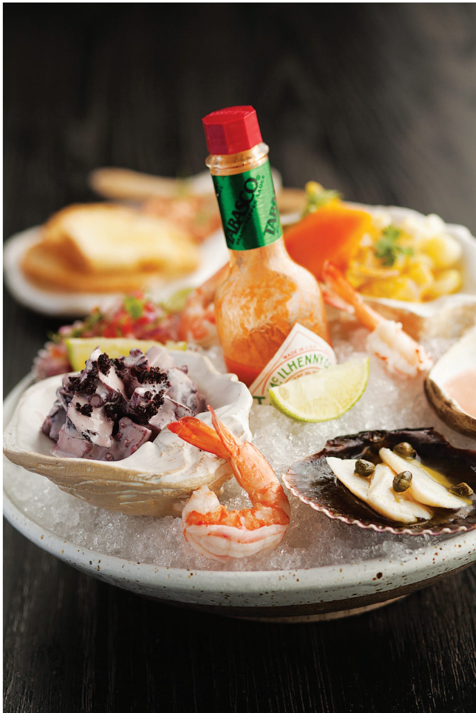
las fotos son referenciales, nuestros platos varían según lo que encontramos en el mercado