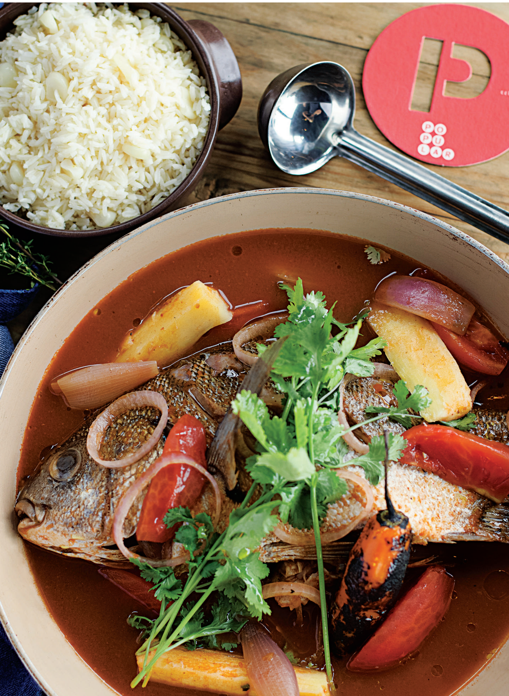
las fotos son referenciales, nuestros platos varían según lo que encontramos en el mercado