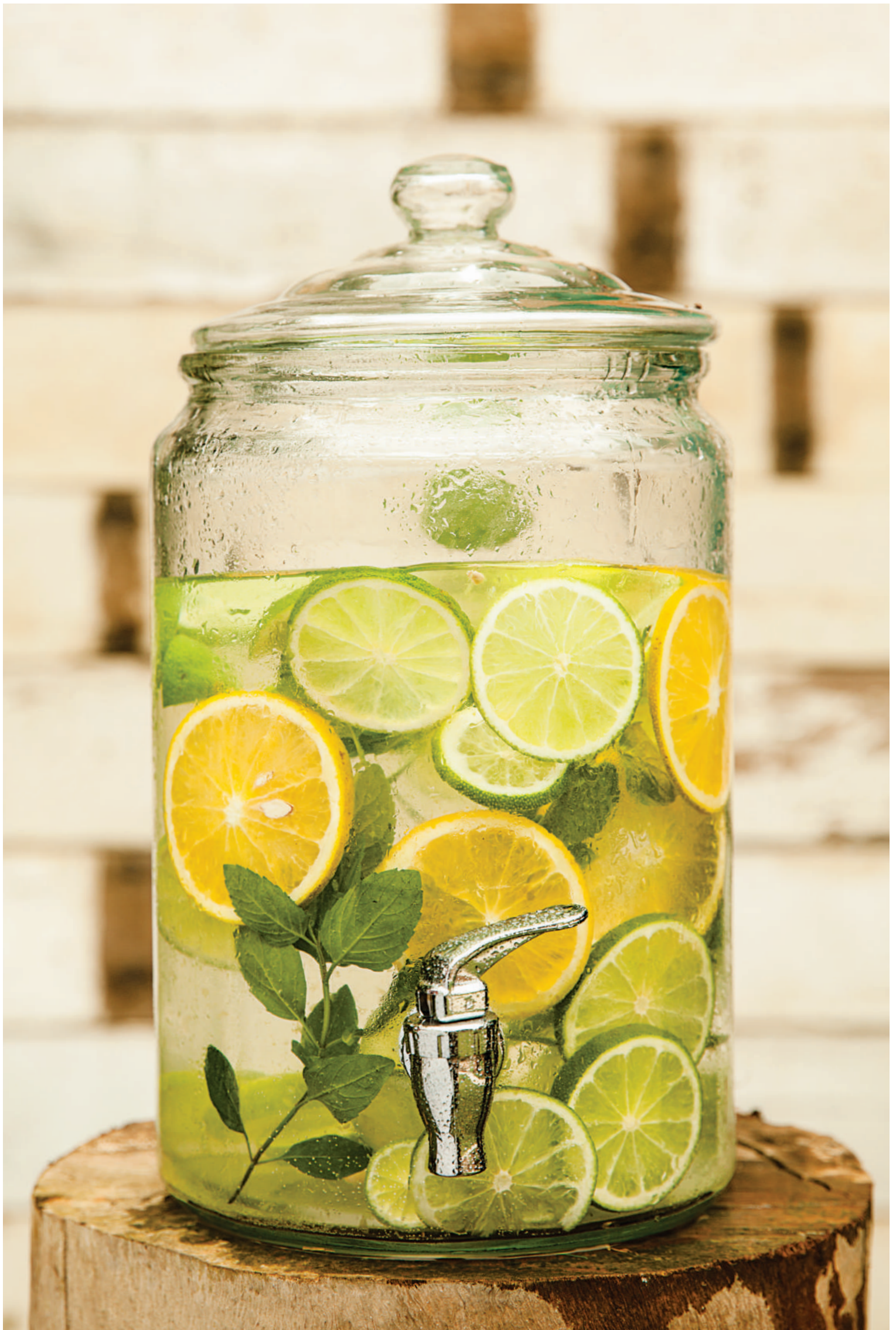
las fotos son referenciales, nuestros platos varían según lo que encontramos en el mercado