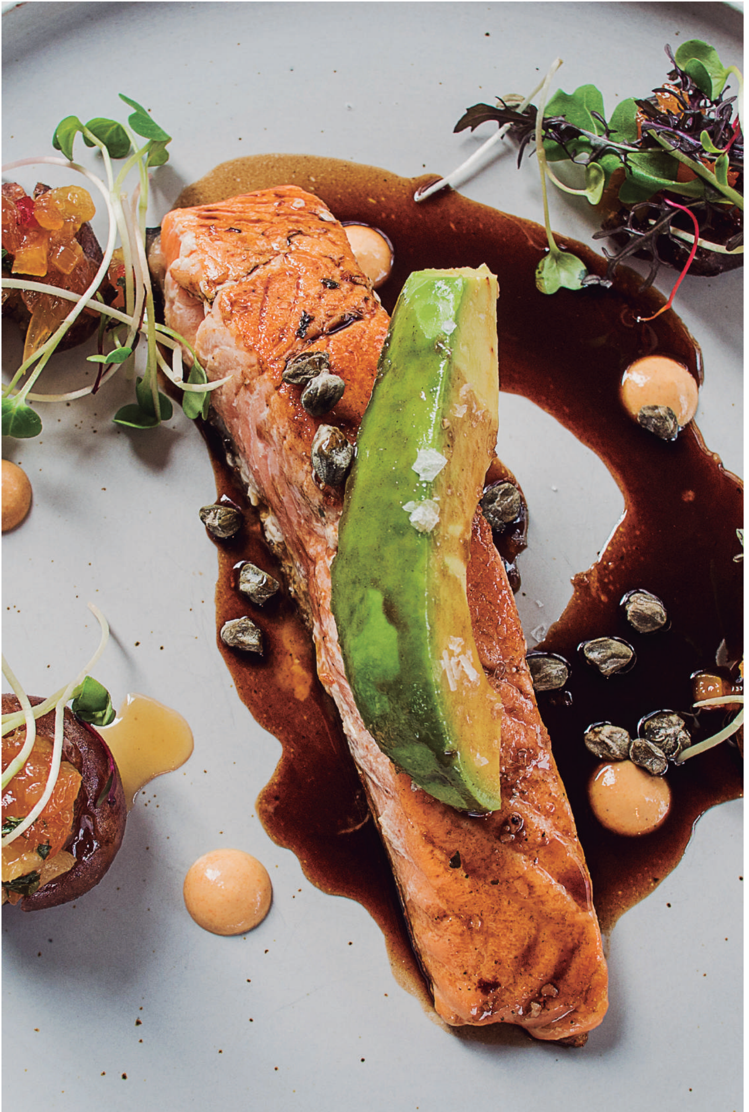
las fotos son referenciales, nuestros platos varían según lo que encontramos en el mercado