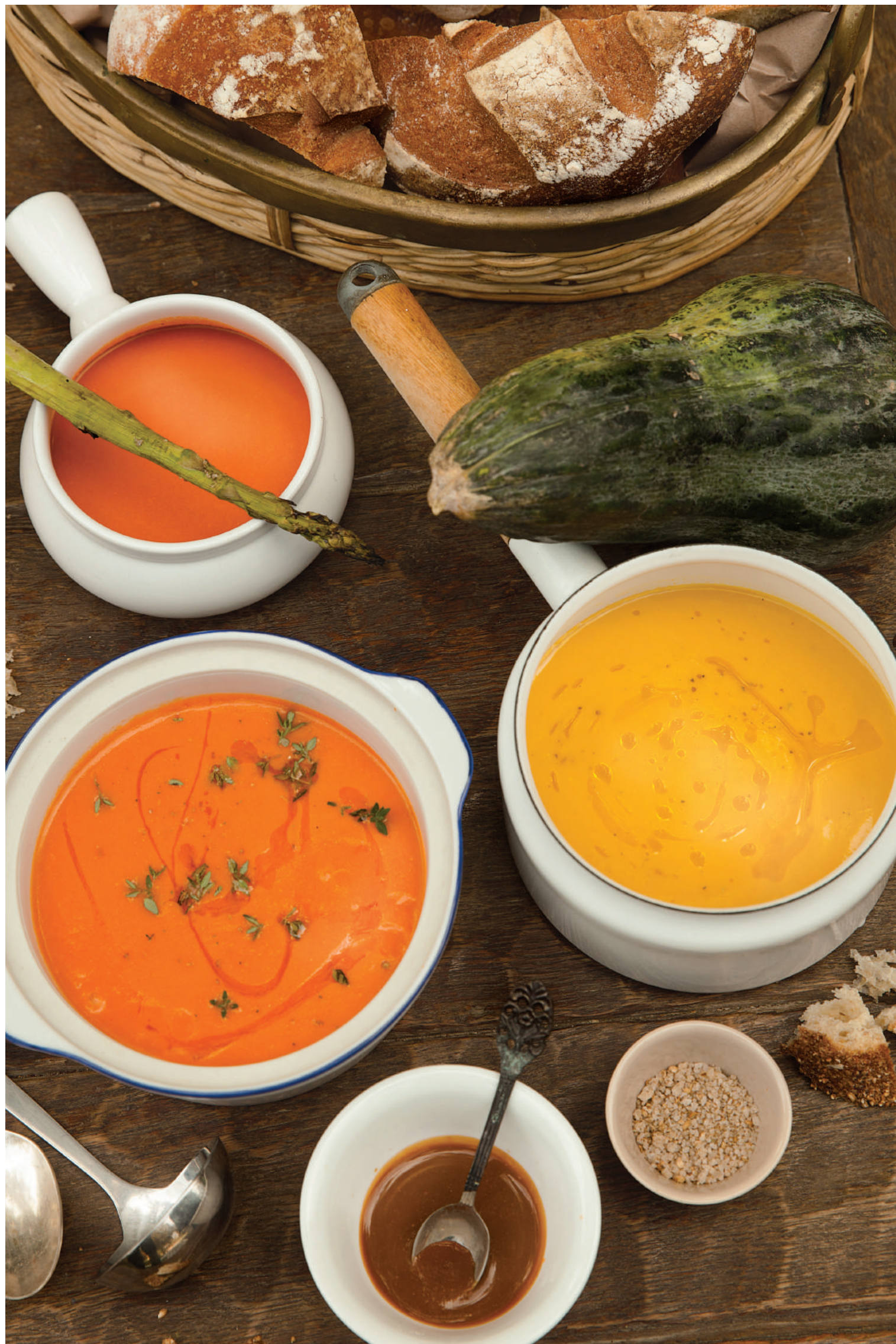
las fotos son referenciales, nuestros platos varían según lo que encontramos en el mercado