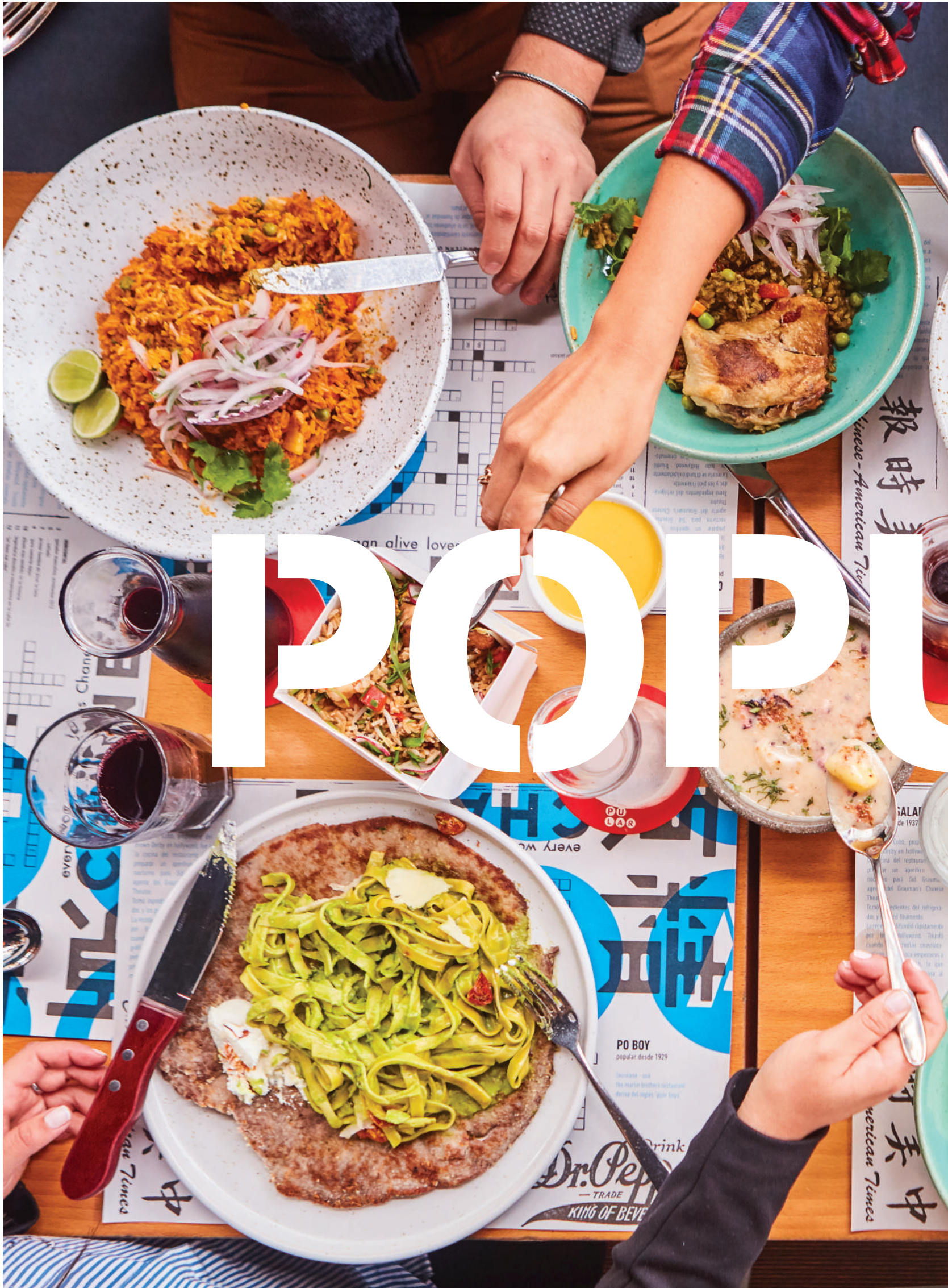
las fotos son referenciales, nuestros platos varían según lo que encontramos en el mercado