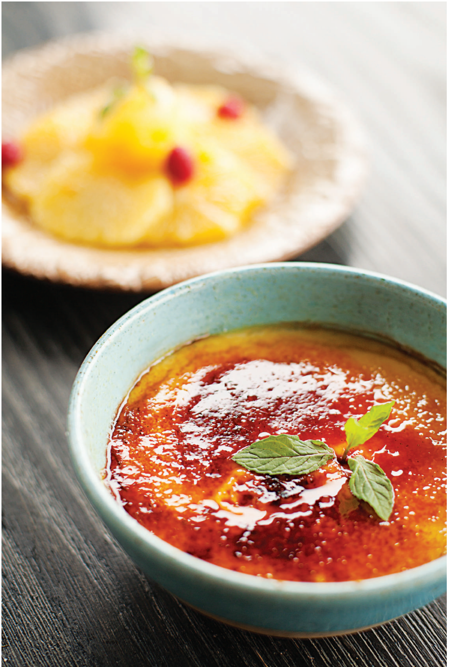
las fotos son referenciales, nuestros platos varían según lo que encontramos en el mercado