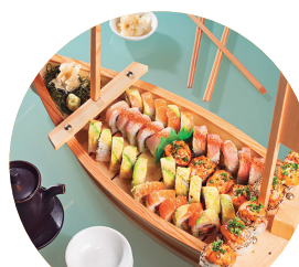
Barco para 2