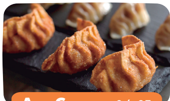
Age Gyoza > S/. 23

Empanaditas fritas de siu-cao relleno de langostinos y cerdo.