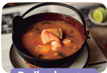
Parihuela > S/. 33

Caldo mixto de cerdo y pollo en láminas.