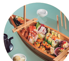
Barco para 4

10 cortes de Sashimi 8 piezas de Nigiri 10 cortes de Makis a elegir entre dos opciones