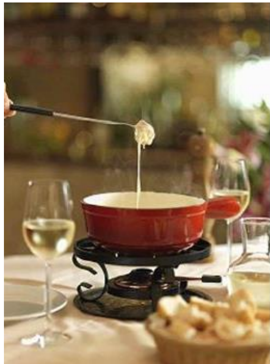
Fondue de Queso