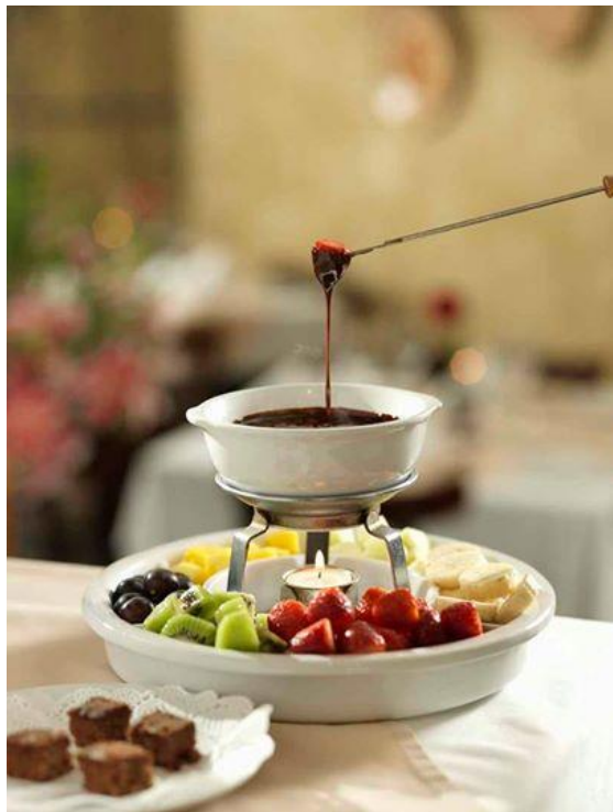
Fondue de Chocolate Toblerone