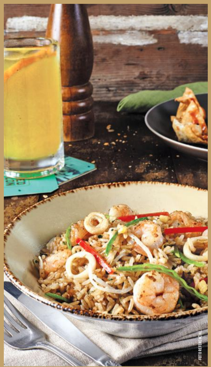
◆ ARROZ TAILANDES DE MARISCOS ◆ Con calamares y langostinos al curry verde, holantao y frejol chino 38