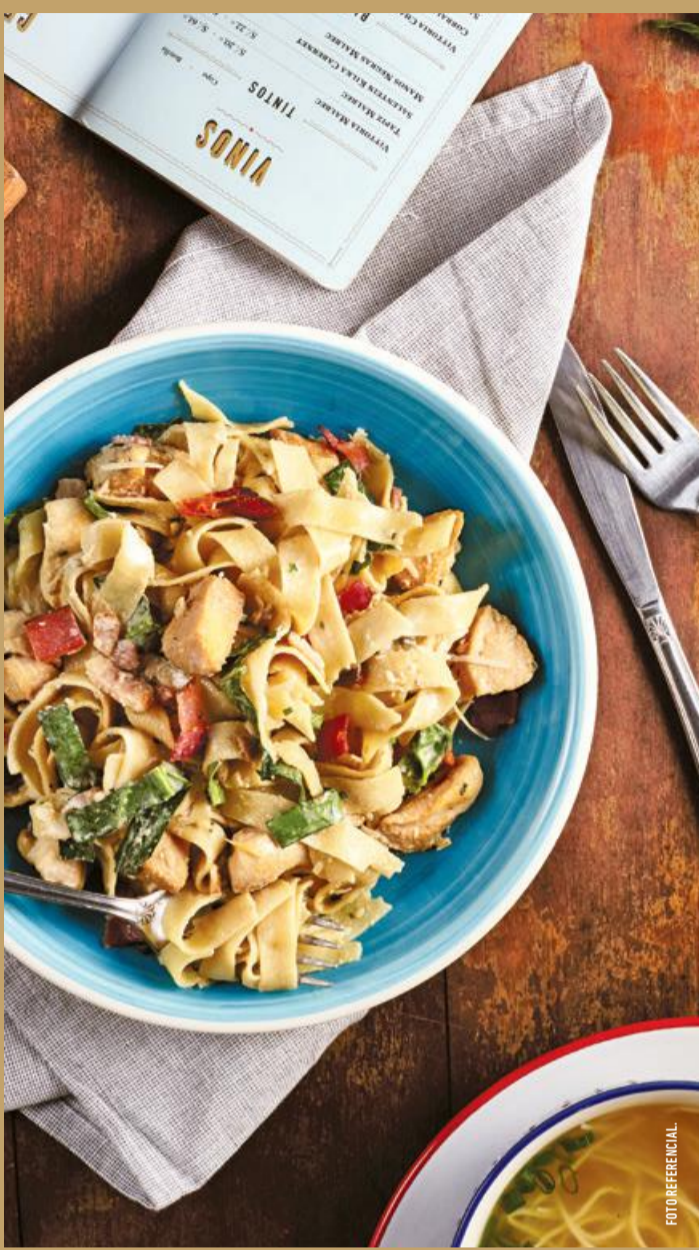
◆ FETUCHINI CON POLLITO GRILLADO ◆ y espinaca 30