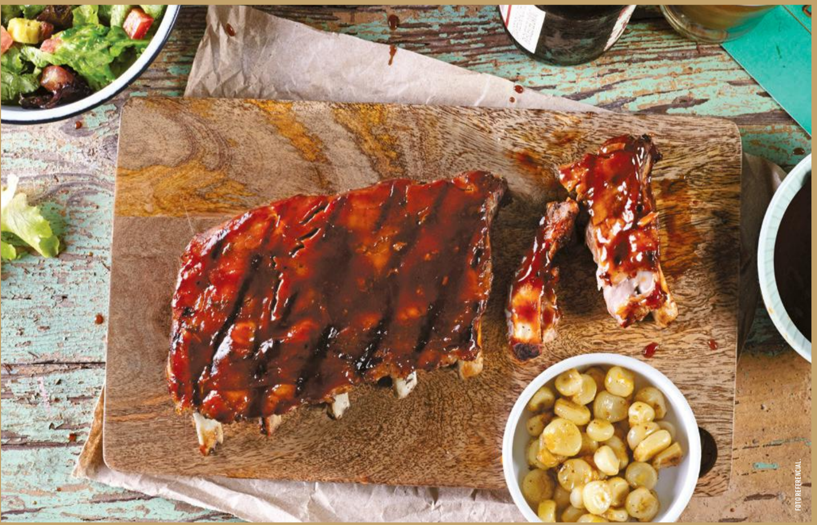
◆ COSTILLAS ◆ Original, clásica salsa BBQ con nuestro toque casero / Rabiosa, la clásica BBQ pero picante Guarniciones: con ensalada fresca y chochlito o papas fritas y coleslaw 38